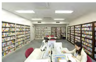
1万冊以上の蔵書を誇る 三方の壁を書棚に囲まれた 編集室風景

カラフルな読み物が巷には溢れていますが、小誌は、集中して読み、知恵やヒントを吸収しやすいように、シンプルな色、デザインにこだわっています。