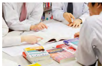
1冊あたり5人以上の編集 員で原著の内容を正確に そして客観性をもって要約