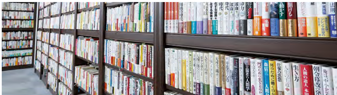
創刊以来読み込んできた書籍は3万冊以上

1987年の創刊以来、多くの経営者をはじめ、 ビジネスの最前線で活躍されている方々に 愛読されてきました。